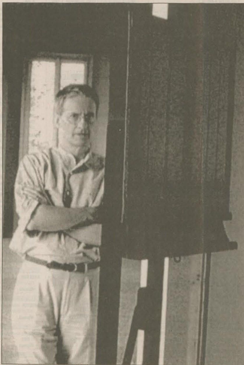
Giulio Paolini. Sotto, un bozzetto per «La Walkiria». A destra, Abbas Kiarostami

«Non credo allo sgomitare contro le barriere della tradizione come fanno certi tedeschi, soprattutto, votati al "rinnovamento", alla "denuncia". Insomma, non credo al jeans nell'opera lirica né a certe attualizzazioni, trovo detestabile aggiornare un'opera di due secoli fa».